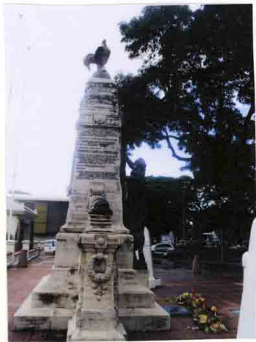
Le monument aux morts.